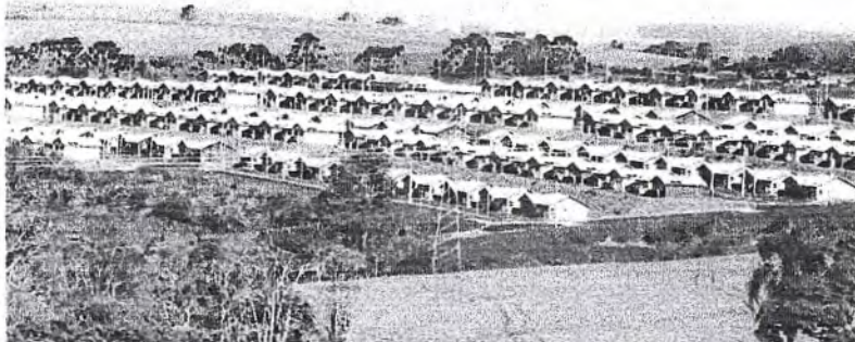
Inscritos disputam 500 moradias do Residencial Solo Sagrado, na região norte de Apucarana